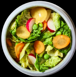
Salade Mix 2,90 €