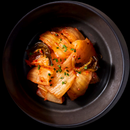
Kimchi 5,90 €